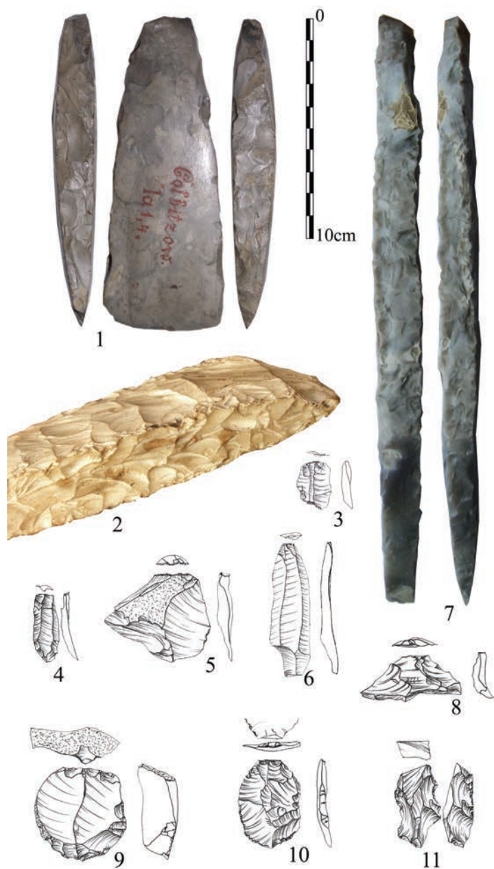
Ryc. 3. Wybór znalezisk obrazujących specyfikę krzemieniarnstwa dolnoodrzańskiej kultury amfor kulistych: 1 – siekiera czworościenna „Lindo” z Kołbaskowa; 7 – dłuto czworościenne „typu Netzelkow”; 3–11 – znaleziska z jam zadokumentowanych na stanowisku Szczecin-Gumieńce 17b. Zabytki znajdują się w zbiorach Muzeum Narodowego w Szczecinie. Nr 2 obrazuje specyfikę formowania grzbietów siekiery na przykładzie okazu „typu Valby” z terenu Rugii.