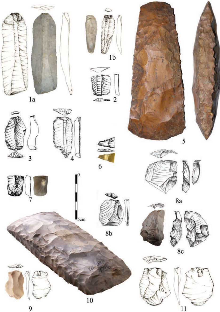
Ryc. 2. Wybór znalezisk reprezentujących specyfikę krzemieniarstwa dolnoodrzańskiej kultury pucharów lejkowatych. Zabytki znajdują się w zbiorach Muzeum Narodowego w Szczecinie.